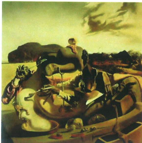
Cannibalisme de l'automne – DALI, 1936

Dali en 1936, dans « Cannibalisme de l'automne », la guerre civile espagnole ayant éclaté, représente deux personnages qui se donnent à manger l'un à l'autre, peut être deux frères ?