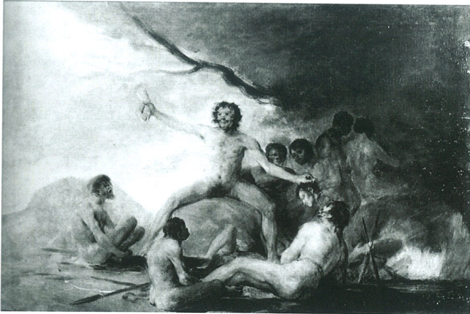
Cannibales dépeçant une victime - GOYA

Goya reprend également ce thème du cannibalisme dans deux autres tableaux conservés au musée de Besançon.