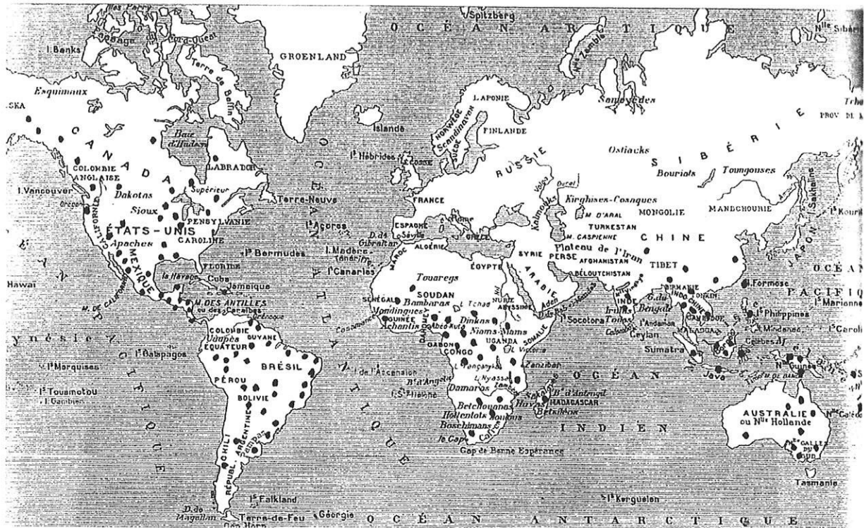
Situation géographique des principaux peuples cannibales au XIXème siècle – Monestier

L'existence de peuples anthropophages est découverte à la fin du XVème siècle grâce aux grands explorateurs partis à la conquête du nouveau monde.