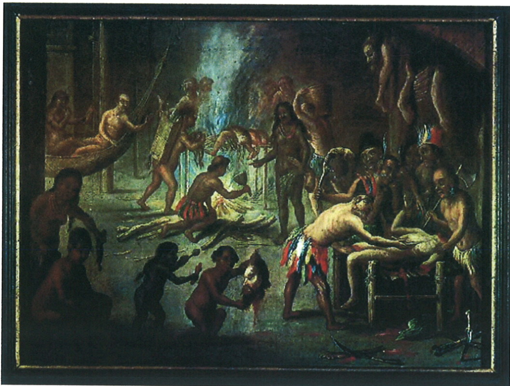
Scène de cannibalisme – Jan van KESSEL LE VIEUX

Jan Van Kessel, dit le vieux, dans « Scène de cannibalisme » peinture sur cuivre, visible au musée du Nouveau Monde de la Rochelle représente, avec de nombreux détails et une très grande minutie, le dépeçage, la conservation, la préparation et la cuisson de la chair humaine. Ce tableau met en scène une tribu d'Amazonie préparant un grand banquet, où sont montrées les différentes phases préparatoires d'un cadavre humain avant d'être mangé.