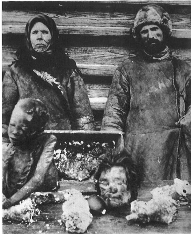
Vente de viande humaine durant la grande famine de 1919 en Russie

n'en parlait. » propos d'Osserguine (BERNHEIM et STAVIDES, 1992 ; RUBIN, 1997 ; MONESTIER, 2000).