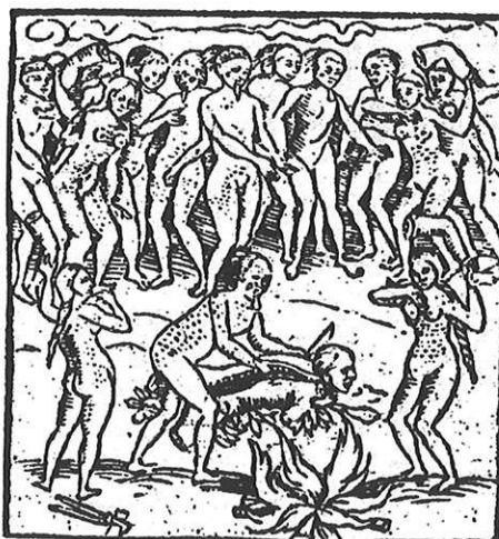
Le découpage – Hans Staden

Les femmes ensuite se saisissaient du corps, lui enfonçant dans l'anus un bâton, pour que « rien ne s'en échappe » ; sa peau était grattée puis il était démembré, ouvert par le dos puis morcelé. Les femmes faisaient alors cuire les entrailles pour obtenir un bouillon qu'elles partageaient avec les enfants.