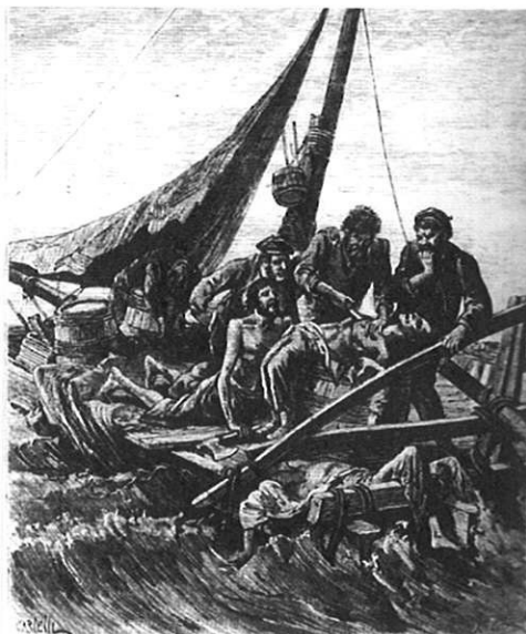
Mousse de la Félicia

Curieusement, c'est souvent le mousse qui était mangé en premier. Sa jeunesse et sa chair tendre faisait de lui un met de premier choix.