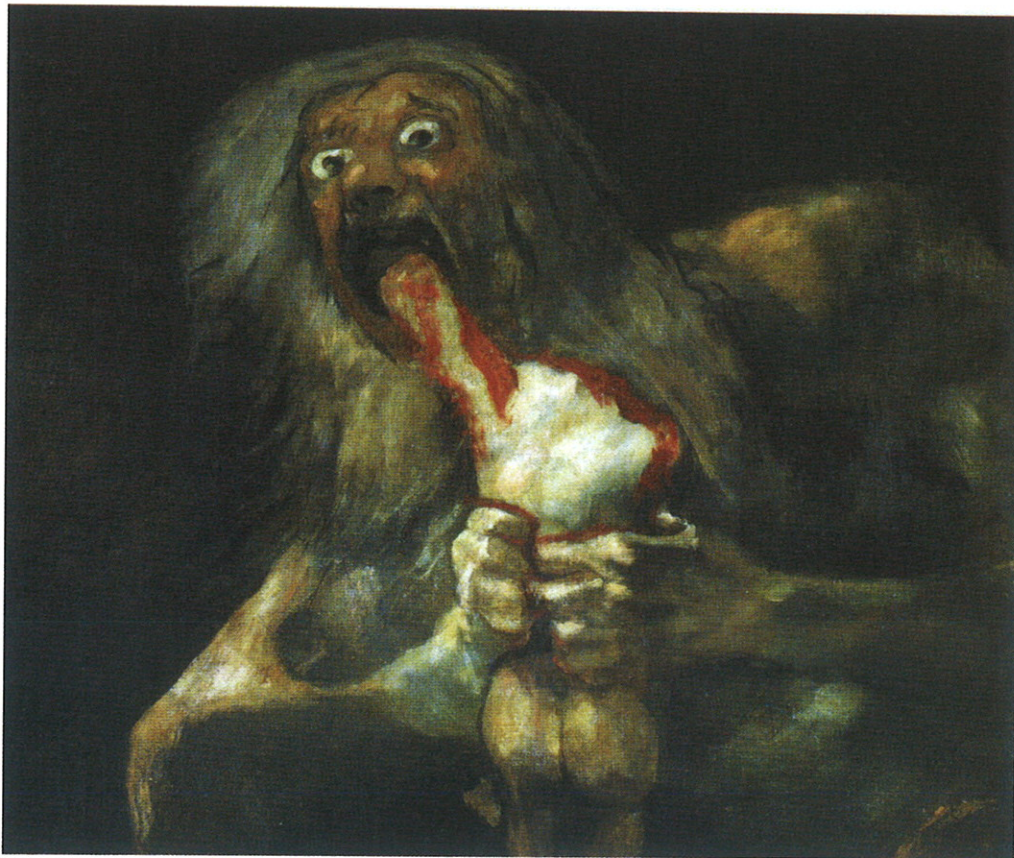
Saturne dévorant ses enfants – GOYA, 1820-1823