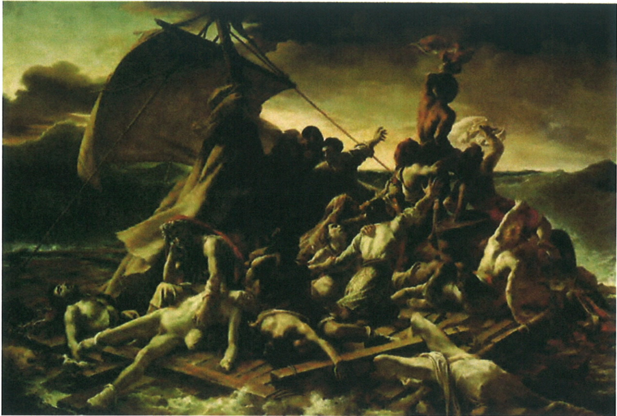
Scène de naufrage - Théodore GERICAULT, 1819

« Scène de naufrage », plus connu sous la dénomination officielle du « Radeau de la méduse » est une huile sur toile (de 4,96m × 7,16m) de Théodore Géricault, de 1819, conservé au Louvre, soit trois ans après le naufrage du bateau « La méduse ».