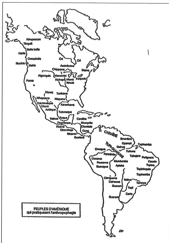
D'après Hans Staden

et à mesure de leurs besoins des morceaux sur leurs victimes, les gardant donc le plus longtemps possible en vie). La consommation de la victime renvoyait également aux autres morts que la victime elle-même avait consommés et par conséquent à la triade incorporation, introjection, identification, mise en évidence par la psychanalyse (GREEN, 1972).