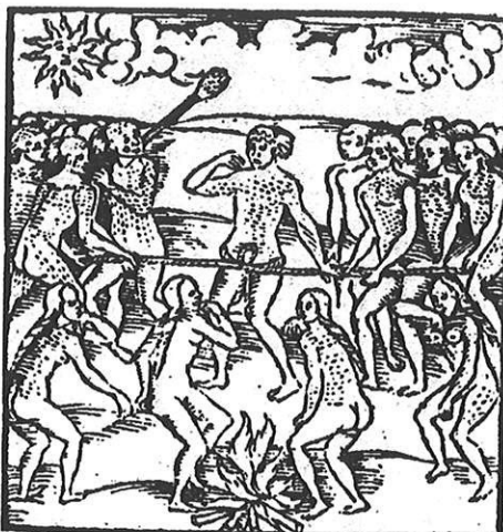
L'exécution – Hans Staden

Le meurtrier alors apparaissait suivi de ses parents et amis, coiffé de plumes, vêtu d'une longue cape de plumes, le visage orné de peintures rituelles, faisant le tour de la place dans un premier temps comme un prédateur menaçant de se jeter sur sa proie, puis ensuite il s'immobilisait devant sa victime. On lui remettait alors l'épée-massue, puis après avoir dialogué avec le prisonnier, il le frappait d'un unique coup de massue sur la nuque, le faisant s'écrouler face contre terre (une chute de l'autre côté était signe de mauvais présage).