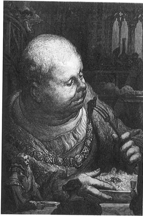
Gargantua mangeant des pèlerins en salade – Gravure (Coll. Ferioli)

Montaigne au XVI ème siècle a sa pensée influencée par différents courants philosophiques, stoïcisme et rigueur, mais c'est dans sa phase sceptique qu'il s'intéressera au cannibalisme. Cette phase de doute correspond en fait à une extrême lucidité de Montaigne, témoignant d'une grande curiosité, d'une tolérance, acceptant avec intérêt toutes les différences et tous les traits de mœurs prouvant justement que les hommes ne pensent pas de la même façon et que ceux qui sont considérés comme sauvages sont peut-être plus sages que nous qui sommes considérés comme gens civilisés.