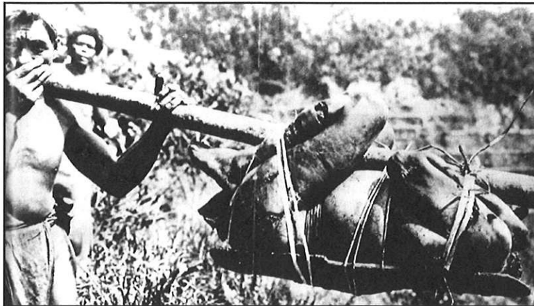
Guerriers cannibales ramenant au village un « gibier » humain décapité – Océanie 1910

Le cannibalisme rituel a fortement régressé grâce à une répression des missionnaires évangélistes, conduisant à l'extermination quasi-totale des tribus anthropophages.